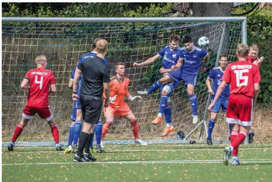
Am 24. Juli 2022 spielten die 1. Herren des SSV zu Hause auf dem Kunstrasenplatz gegen den WSV Tangstedt.