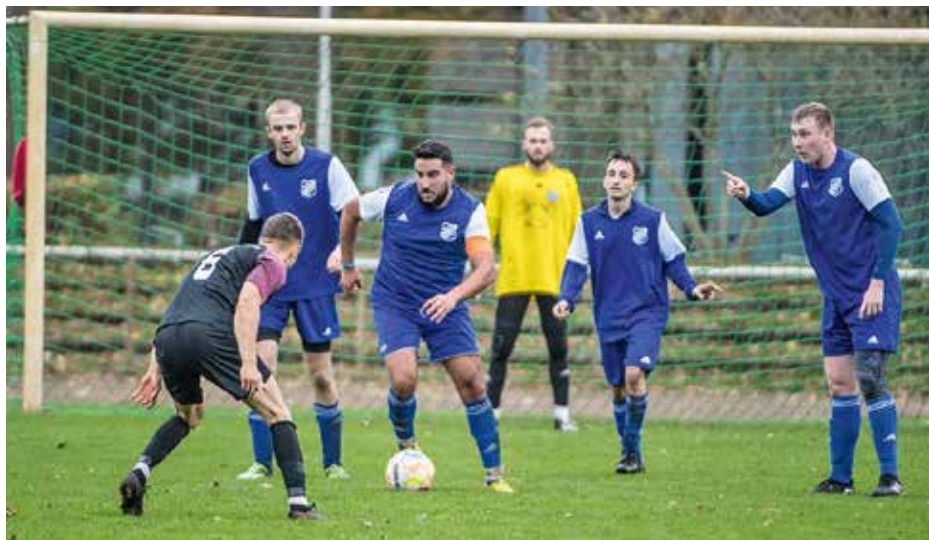
Am 23. Oktober spielten die 3. Herren gegen Sportfreunde Uetersen.

Dazu kommen im Punktspielbetrieb unsere Alte Herren, die in der Lan-