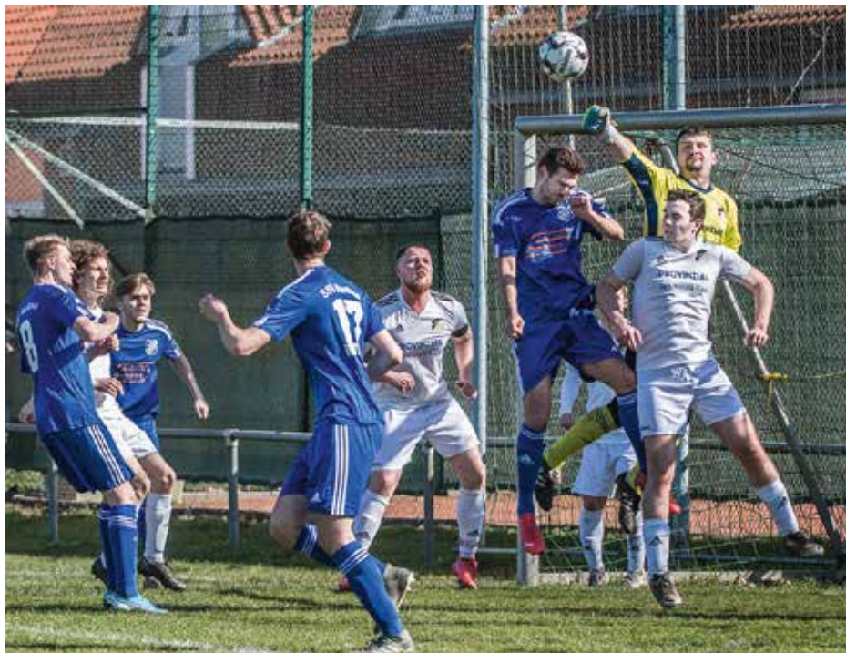
Eine Szene aus dem Spiel der 2. Herren des SSV gegen den TSV Sparrieshoop. Das Spiel fand am 27. März 2022 in Sparrieshoop statt.