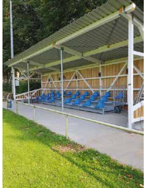
2020: Bau der Zuschauertribüne mit 50 Sitzplätzen auf D1 in Eigenarbeit.