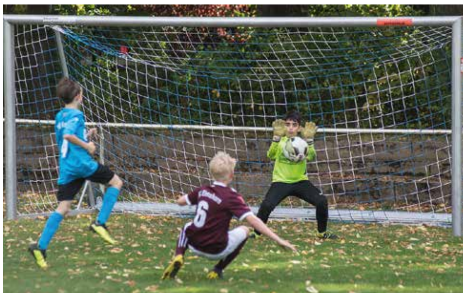
E-Jugend-Spiel am 28. Sept. 2019

mannschaften im Spielbetrieb hat, was nur noch wenigen Vereinen im HFV gelingt. Einen tollen Aufschwung gibt es im Mädchenfußball mit derzeit vier Mädchenteams.