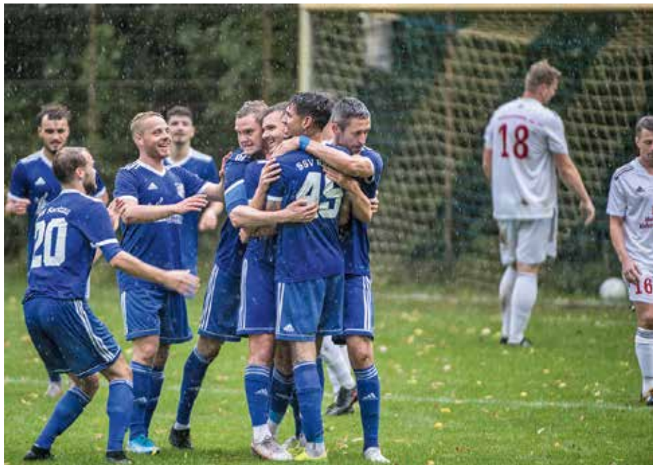
Torjubel der 1. Herren am 17. Sept. 2022 im Spiel gegen den Kummerfelder SV.