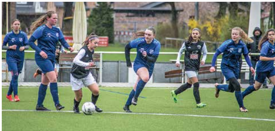
Spiel der B-Mädchen gegen FC Bergedorf 85 am 2. April 2023

Der SSV Rantzaу unterhält aktuell 19 Kinder- und Jugendteams in allen Altersklassen. Besonders erfreut sind wir, dass der SSV Rantzaу im Jubiläumsjahr zwei A-Jugend-