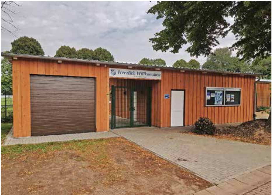
2021: Bau des Multifunktionshauses in Eigenarbeit